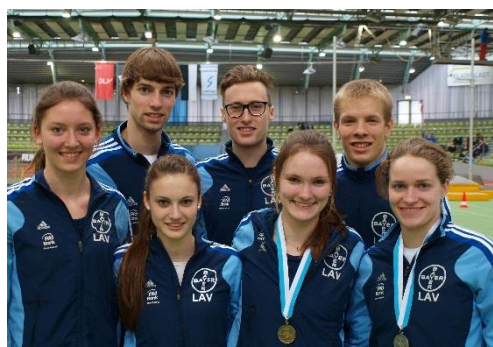
Abbildung 2: Die Teilnehmer an den Deutschen Hallenmeisterschaften